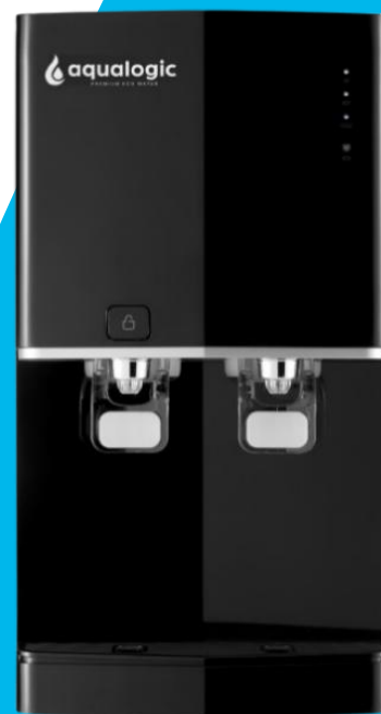
Luz Ultravioleta LED en tanque

Aqualogic combina la ciencia del agua y las últimas tecnologías disponibles para ofrecer un agua segura y con gran sabor.